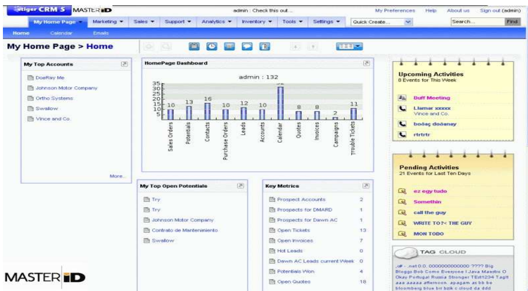
Figura 1: iCRM com MASTER ID – Tela Principal

A Solução tem uma BASE DE CONHECIMENTO de clientes, que possibilita a DIFERENCIAÇÃO E SEGMENTAÇÃO de clientes em termos de seu valor para a empresa e de suas necessidades, mapeando e classificando os clientes de maior valor e os clientes de maior potencial para desenvolvimento de negócios ou relacionamento (pessoal ou profissional). Com isto, é possível combinar conhecimentos e relacionamentos e a partir daí incentivá-los a adquirir produtos e serviços através de campanhas interativas, up-selling e cross selling, se for o caso, desenvolvendo uma relação de aprendizado, criando relações de interatividade PERSONALIZADAS, de ALTO VALOR AGREGADO e VISÕES de conveniência, permitindo longevidade na relação, fidelização e encantamento.